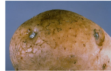
Fot 3 i 4. Wyciek śluzu z oczek bulwy i przekrój przez porażoną bulwę z zamierającymi wiązkami przewodzącymi