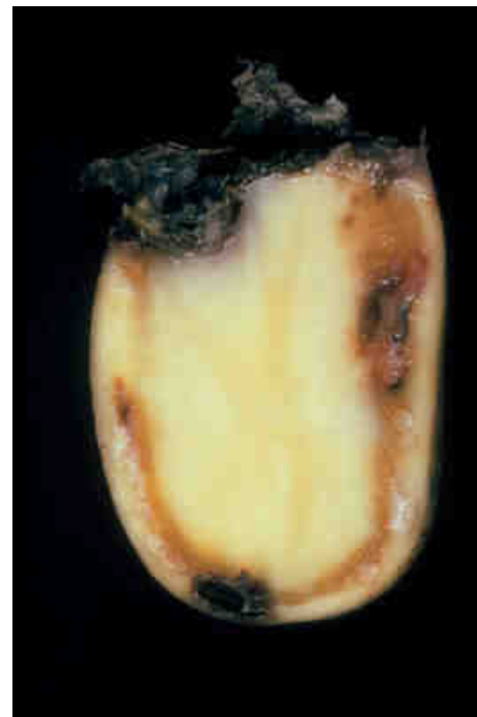
Fot. 1. Przekrój przez porażoną bulwę z zamierającymi wiązkami przewodzącymi

bakteria wywołująca chorobę ziemniaków zwaną śluzakiem (brązową zgnilizną lub brunatną zgnilizną ziemniaka)