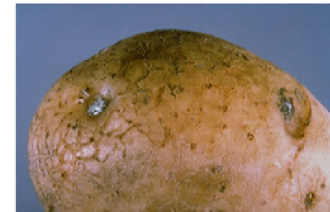
Fot 3 i 4. Wyciek śluzu z oczek bulwy i przekrój przez porażoną bulwę z zamierającymi wiązkami przewodzącymi