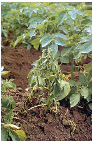
Fot 1 i 2. Wędnące rośliny ziemniaka